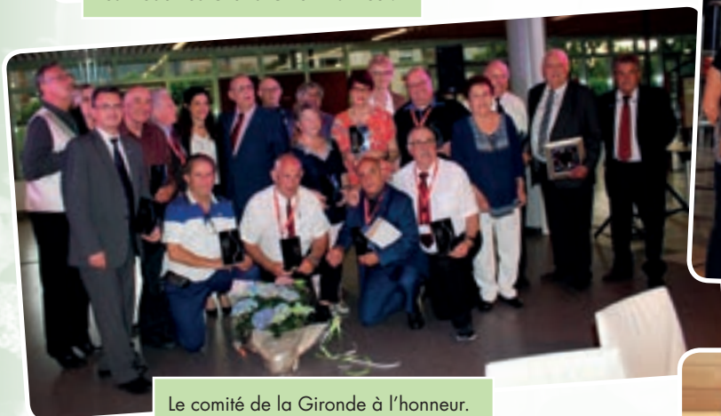
Le comité de la Gironde à l'honneur.