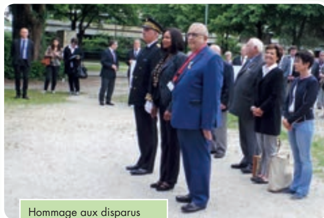
Hommage aux disparus avec Madame La Ministre

La visite de notre Ministre de tutelle Laura FLESSEL, le 24 mai, a rehaussé la tenue du dépôt de gerbes au Monument de l'Armée des Ombres à Bordeaux. Elle a ainsi marqué son attachement et la reconnaissance de l'Etat à notre Fédération, honorant tous les bénévoles qui oeuvrent au service du Sport, de la Jeunesse et de l'Engagement Associatif. Nous lui renouvelons nos très chaleureux remerciements.