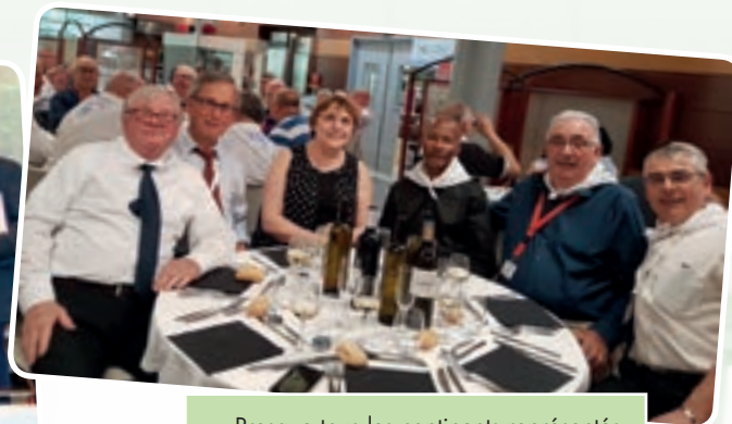
Presque tous les continents représentés.