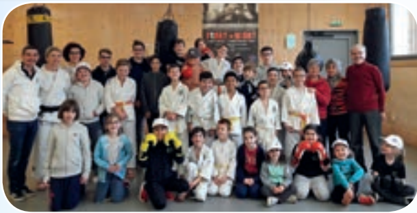
Tous unis par le sport.