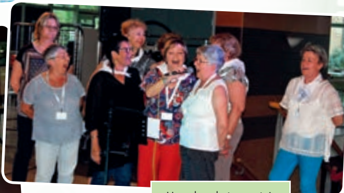
Une chorale improvisée.