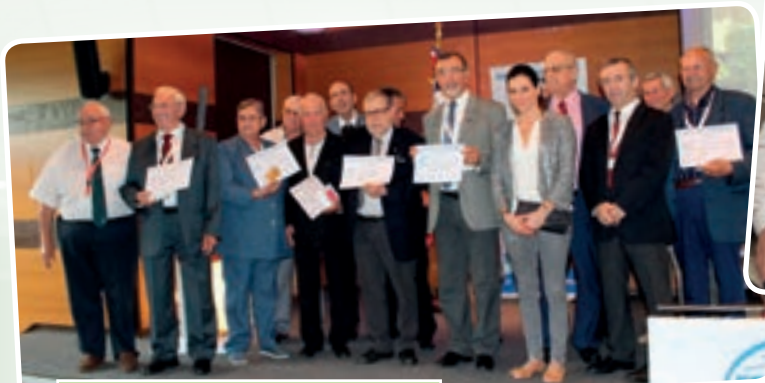
Les médaillés Grand Or à l'honneur.