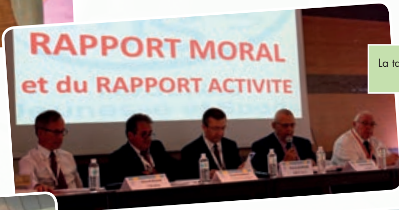
La table officielle de l'AG.