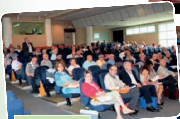
Le public participatif.