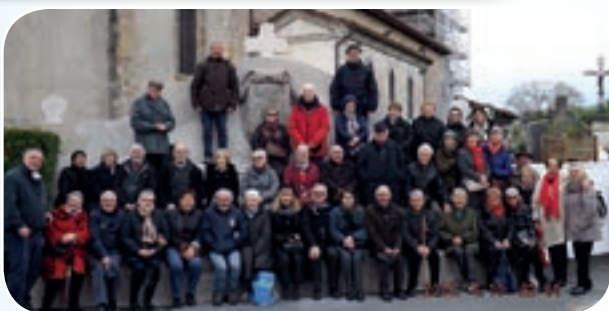
Dans le village d'Arcangues, lieu de repos de Luis Mariano, devant l'église typique du Pays Basque avec ses galeries et boiseries.