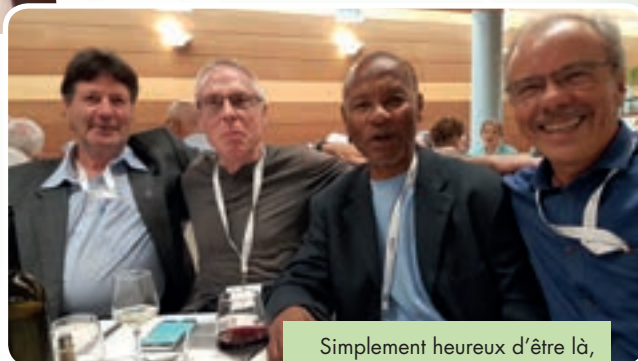
Simplement heureux d'être là, c'est aussi simple que cela.