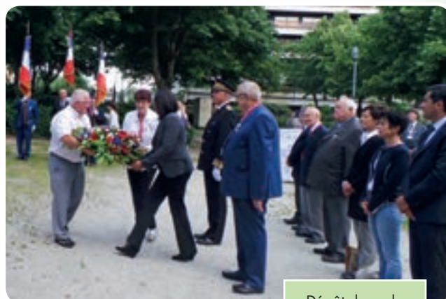
Dépôt de gerbes