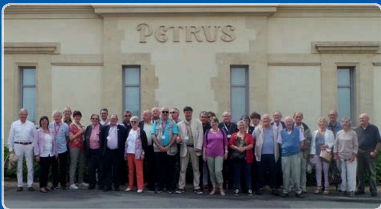
En visite dans le Bordelais...